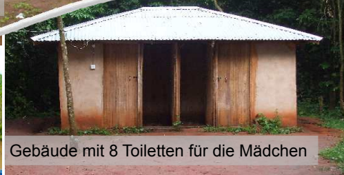
Gebäude mit 8 Toiletten für die Mädchen