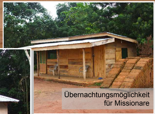
Übernachtungsmöglichkeit für Missionare