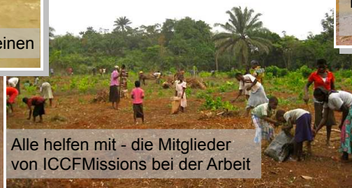
Alle helfen mit - die Mitglieder von ICCFMissions bei der Arbeit