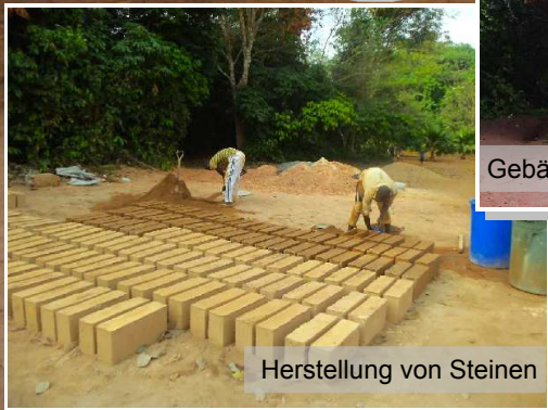
Herstellung von Steinen