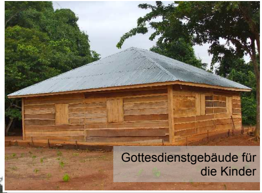
Gottesdienstgebäude für die Kinder