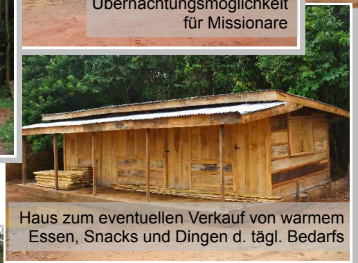
Haus zum eventuellen Verkauf von warmem Essen, Snacks und Dingen d. tägl. Bedarfs