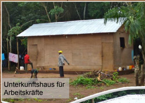
Unterkunftshaus für Arbeitskräfte