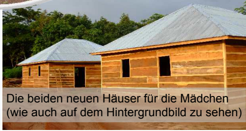
Die beiden neuen Häuser für die Mädchen (wie auch auf dem Hintergrundbild zu sehen)