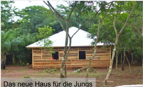
Das neue Haus für die Jungs